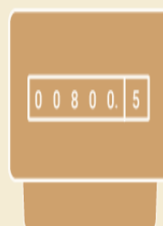
Индивидуальный прибор учета (ИПУ) электроэнергии

Перерасчету подлежит размер платы за все коммунальные услуги, кроме отопления